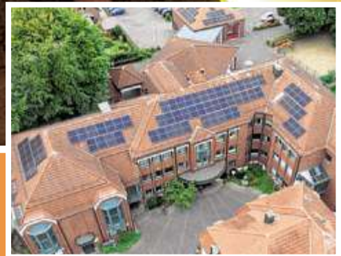
Die Stadt Wassenberg errichtet auf ihren Gebäuden weitere Photovoltaik-Anlagen. Sie wird sich auch an einer PV-Freiflächen-Anlage auf der Deponie in Rothenbach beteiligen.