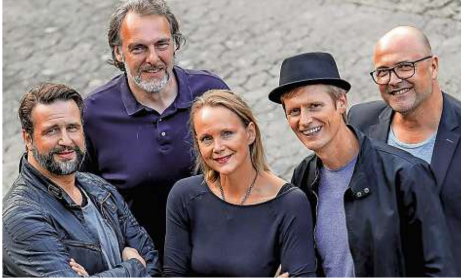
Die Gruppe "beets'n'berries" trägt gleich mehrfach zu einer zauberhaften Adventszeit in Wassenberg bei.

des Outfit aufpeppt, Mützen, Schals und Krautwatten für die kalte Jahreszeit.