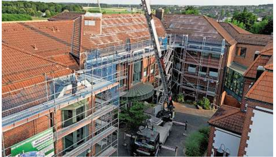
Das Rathaus wurde nicht nur mit einer PV-Anlage mit 43,5 kWp ausgestattet, sondern dabei auch die gesamte Elektro-Hauptverteilung erneuert, um alle Sicherheitsbestimmungen einzuhalten, Kapazitätsreserven zu schaffen und die Anlage maximal effizient betreiben zu können.

Der Kreis Heinsberg plant schon länger, die rekultivierten Teile der Deponie für PV-Anlagen zu nutzen. Ein Konzept sieht vor, Solarfelder in zwei Schritten auf mehr als 23 Hektar zu errichten. Der erste Teilbereich erstreckt sich auf rund 15 Hektar über eine Fläche, die bereits heute mit Photovoltaik-Modulen belegt werden könnten.