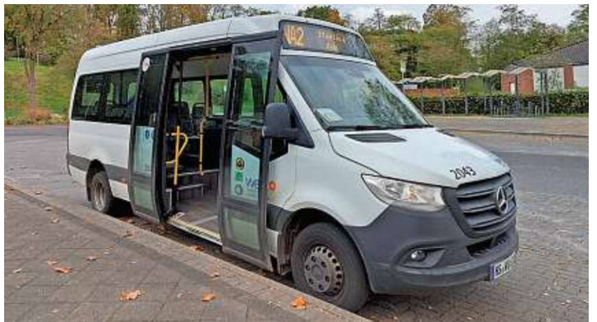
Bequem zum Einkaufen, zum Friedhof, zum Sportpark oder zum Parkbad: Das Interesse am Stadtbus in Wassenberg wächst.

Nicht nur der Stadtbus fährt zum Sondertarif von einem Euro durch Wassenberg.