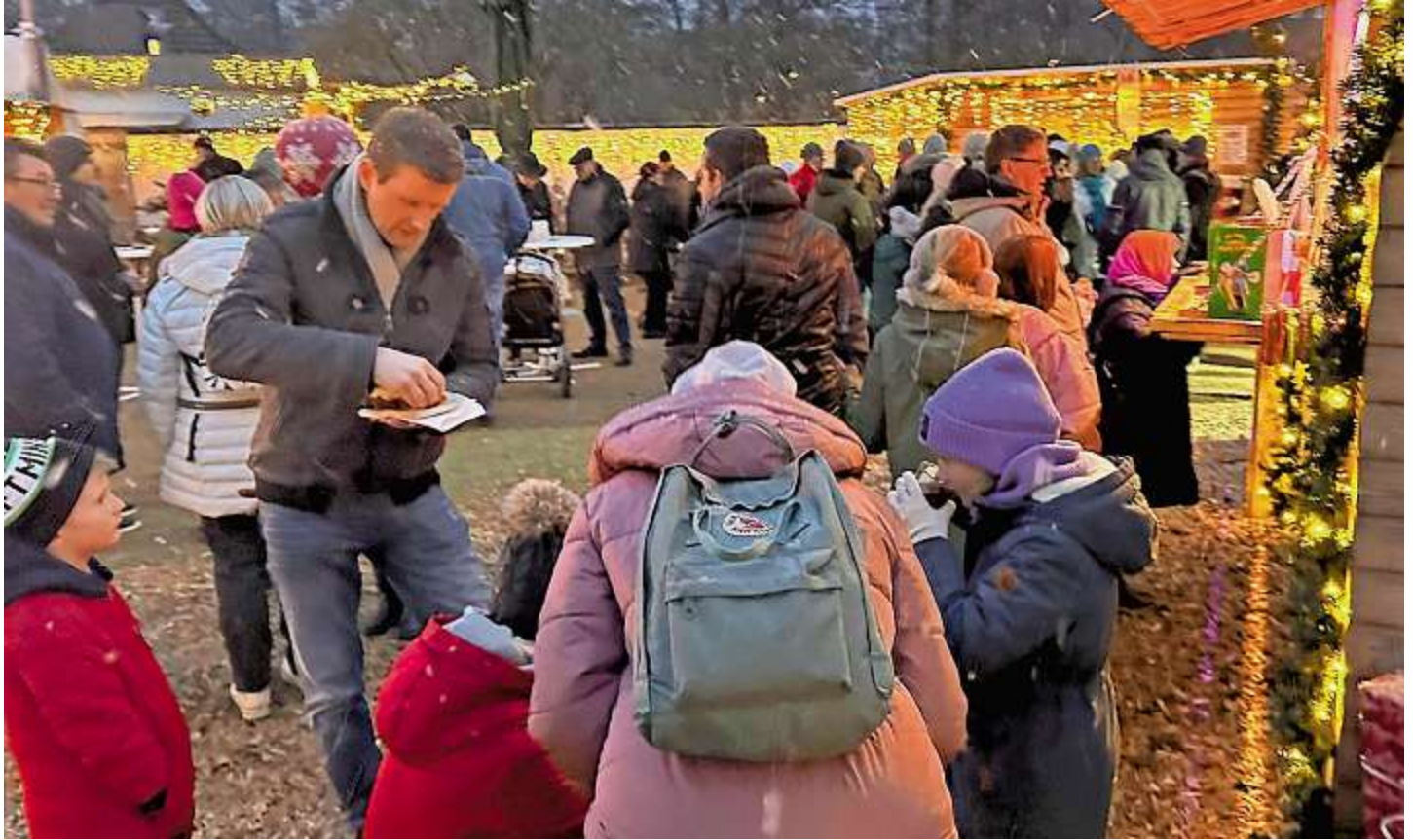
Der Adventszauber ist auch ein Treff für Genießer.