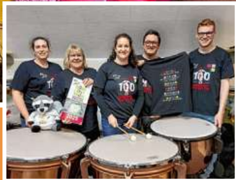
Der Musikverein Birgelen feiert 2025 sein 100-jähriges Bestehen mit einem spannenden Programm. Schon in wenigen Tagen startet eine Promo-Tour.