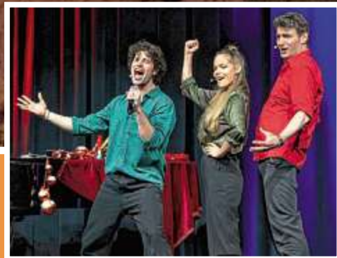
Mit seinem Weihnachtskabarett „Merry Christmas“ kommt das Improvisationstheater Springmaus am 7. Dezember ins Forum der Betty-Reis-Gesamtschule.