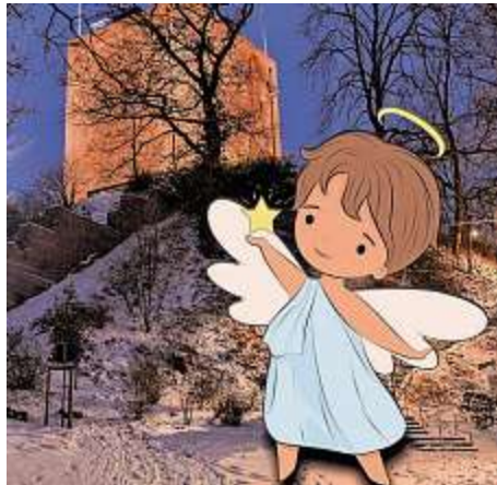
Lotte lädt wieder zur Wassenberg-Rallye ein.

Zur Geschichte: Lotte, der Weihnachtsengel, langweilte sich im Himmel. Lotte wollte so gerne etwas Spannendes erleben, aber was und wo? Da fiel ihr Blick zur Erde hinab, Wassenberg weckte ihr Interesse. Sie flog hinunter