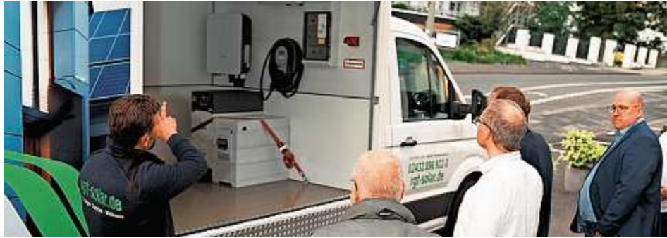
Beim Wirtschaftstreff stellte die RGT Solar auch ihr Infomobil vor.